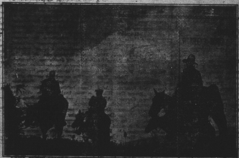
Après avoir été sillonné de longues heures sur leurs solides poutres obliques et avoir admiré les plus grandes panoramas que les Rocheuses offrent aux touristes, ces cavaliers se dirigent lentement vers leur camp où ils se reposent des fatigues d'une journée bien remplie. Ils font partie de la société des "Chevaliers des Rocheuses" dont les membres, chaque année, se réunissent pour explorer à cheval quelques régions choisies des montagnes de l'Ouest. Ces cavaliers ont visité le Parc qui avoisine Banff et Lac Louise et ont obtenu leurs participations par un grand succès. Le site des Rocheuses, situé entre les stations de Lac Louise et de Field, sur le versant du Frontière Canadien.