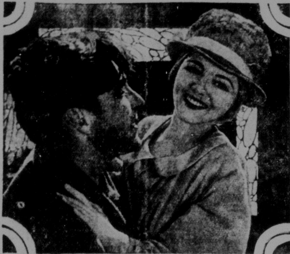
George O'Brien and Janet Gaynor in Sunrise Fox Picture -

В ПЯТНИЦЮ, 8. ЛИСТОПАДА, ВІД ГОД. 8.30 ВЕЧЕРОМ В СУБОТУ, 9. ЛИСТОПАДА, ВІД ГОД. 7.01 ВЕЧЕРОМ В УКР. РОБІТНИЧИМ ДОМІ У ВІННІПЕГУ