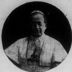
Le Pape des Missions Le Pape de l'Action Catholique Le Pape des Jeunes.