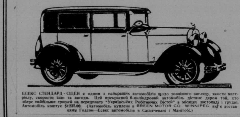
ЕССЕК СТАНДАРД - СЦЕН є одним з найкращих автомобілів щодо зовнішнього вигляду, якості матеріалу, швидкості їзди та виграє. Цей прекрасний 6-циліндровий автомобіль дістане даром той, хто збере найбільше грошей на передплату "Українських Робітничих Вістей" в місяцях листопада і грудні. Автомобіль коштує $1235.00. (Автомобіль куплено в GREEN MOTOR CO. WINNIPEG як є доставляють Гоудсон-Ессек автомобілі в Саскчевані і Манітобі.)

Нас повідомляють, що в деяких місцевостях збірка нових і старих передплат йде досить успішно. З інших знову пишуть, що зразу багатьох товаришів зацікавило справою придбання нашої газети нових передплат, але по кількох днях праці побачивши, що хтось один з них придбав кілька передплат більше і стоїть покищо найвище, вони думають, що їм не пощастить добитися нагороди. Цим не треба зражуватися. Нині пощастило комусь одному здобути кількох передплатників, а завтра пощастить вам. Треба далі і невпинно працювати аж до кінця грудня. Не забувайте, що нагорода буде розділюватися не після одної тільки місцевості, але після здобутків усіх місцевостей цілої Канади. Тому далі до праці, товариші!