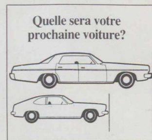
Un message publicitaire.

Le ministère canadien de l'énergie, des mines et des ressources a pris, il y a maintenant cinq mois, l'initiative d'une campagne publique de lutte pour les économies d'énergie. Certes, a dit le ministre,