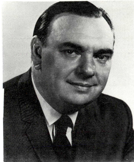
Donald C. Jamieson, nombrado recientemente Ministro de Asuntos Exteriores, era el Ministro de Industria y Comercio.

En 1963, el Sr. Jamieson actuó de miembro del comité creado por el Gobierno Federal para estudiar diversos aspectos de la radiodifusión canadiense. En 1965 completó un período de cuatro años como presidente de la Asociación Canadiense de Radiodifusores. Como radiodifusor privado, actuó en distintos comités de dicho ramo, incluso en uno que trataba de las relaciones técnicas entre Radio Canadá y sus afiliados privados.