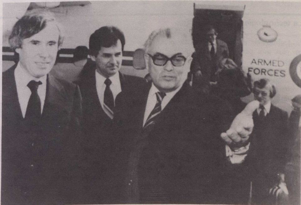
Le secrétaire d'État aux Affaires extérieures, M. Mark MacGuigan, est accueilli à Budapest par le ministre hongrois des Affaires étrangères, M. Frigyes Puja (à droite).

Le Sommet devrait se tenir l'été prochain à Mexico.