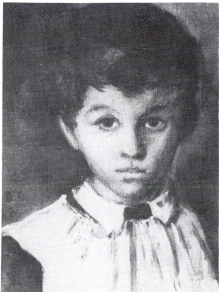
Portrait d'Alphonse Puvis de Chavannes – 1858

Parmi les oeuvres présentées dans l'exposition, l'Été (1873) est l'une des plus grandes toiles montées sur châssis que comprend l'oeuvre de Puvis. Elle permet d'apprécier la technique de l'artiste dans l'exécution de ses grands formats. Avec Jeunes filles au bord de la mer (1879), s'ouvre la période de pleine maturité de l'artiste qui, pendant les sept ou huit années qui suivront, produira une série de chefs-d'oeuvre absolus dans les différents domaines d'expression qu'il a privilégiés.