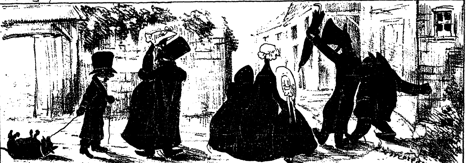
3 h du matin. — Ils ont complètement perdu leur chemin. — Paul n'ouvre plus la marche, M lle Finesse est émue, les payas chantent "le drapereau de Carillon", Azor est assommé! Comment tout cela finira-t-il?