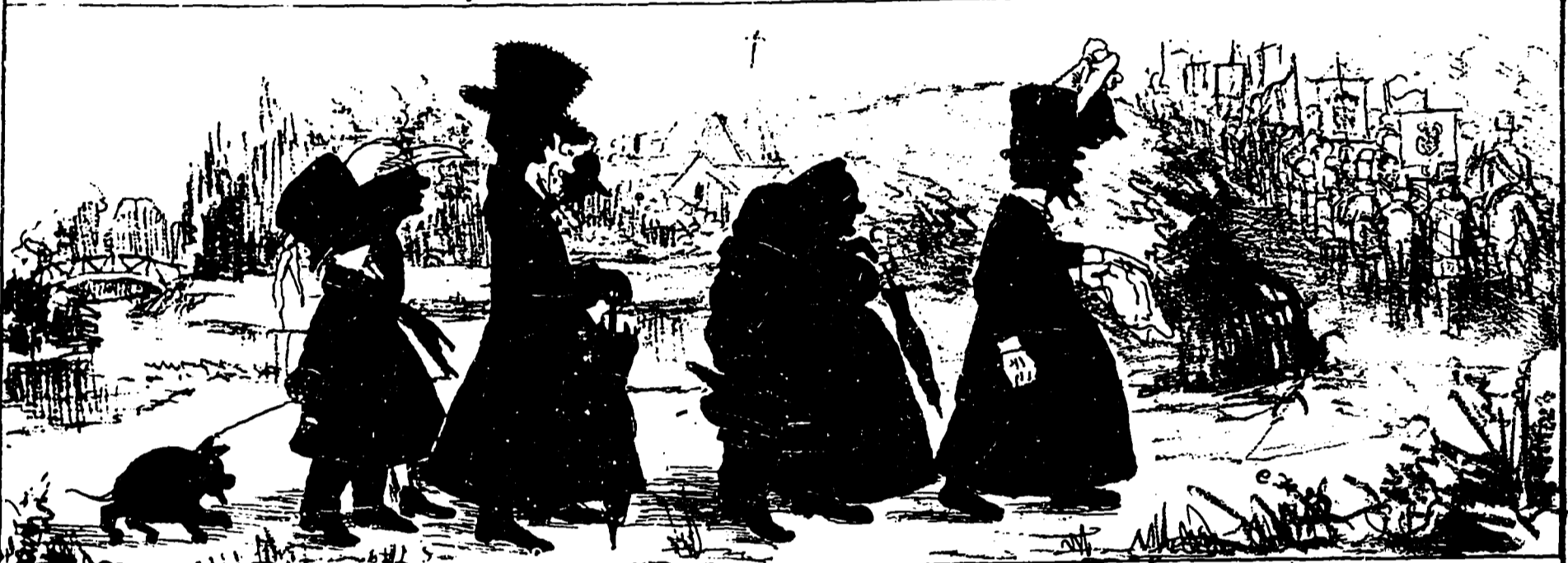
Les deux familles étant rejointes, Paul offre son bras à M lle Finesse et, sous les regards paternels, ils ouvrent le marche pour rejoindre la procession. Azor est fatigué; M re Finesse se soif! Tigecurman raconte la guerre américaine.