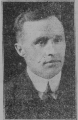
HON. GARDINER har utpekats av de konservativa i Saskatchewan som "katolskt redskap".

Då Canada ju är ett ur religionsynpunkt fritt land och varje religionsutövare har rätt att bekänna sig till den religionsäskad-