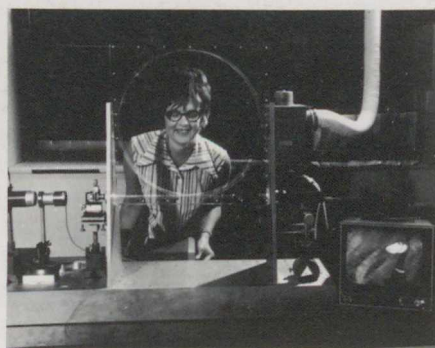
Le rayon lumineux (à gauche) suit la boucle centrale et vient exciter un détecteur qui restitue l'image sur un écran.

points inaccessibles (en chirurgie, par exemple, pour les examens internes), la technique des fibres optiques rendrait de grands services dans le domaine des communications urbaines s'il était possible de l'adapter aux longues distances. En vue de résoudre les problèmes qui se posent, une équipe de spécialistes des centres de recherches du ministère canadien des communications et de la société Bell-Northern s'est engagée dans des études qui doivent lui permettre de réaliser un système expérimental comportant plusieurs kilomètres de fibres optiques.