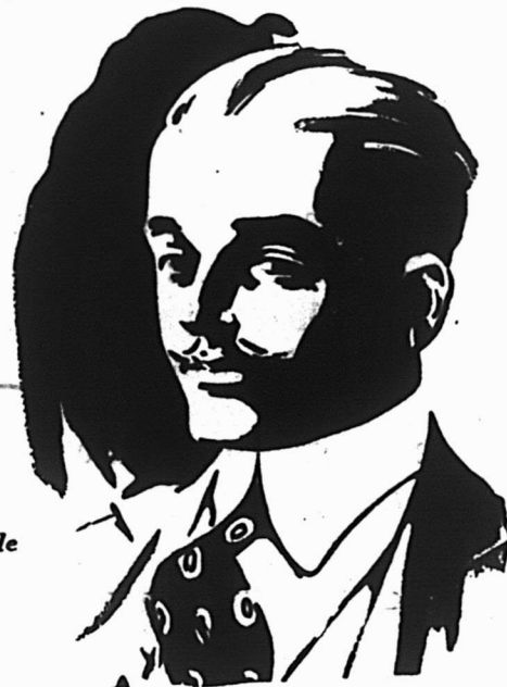
Nouvelle forme ajustée