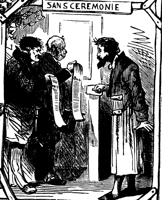
UNE VISITE DESACREABLE