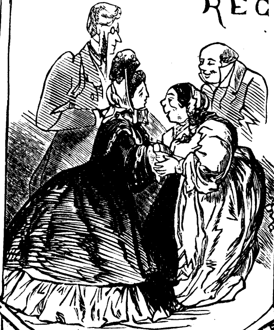
LE BONJOUR ET LERENDRE