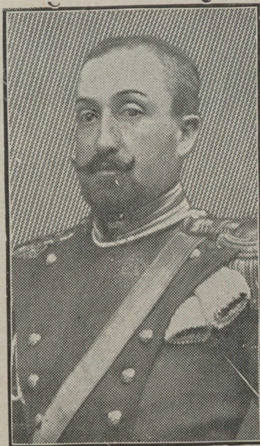
Le Prince Louis-Napoléon, commandant de la cavalerie russe en Extrême-Orient.

Il existe au Japon un parti dit: Parti nationaliste antirusse, qui compte dans ses rangs une dizaine des membres les plus influents du gouvernement japonais. C'est ce parti très vigoureux qui, redoutant l'influence russe en Mandchourie et en Corée, a forcé le gouvernement de Tokio à ouvrir les hostilités. Le comte Okuma, dont nous donnons ici le portrait, est le chef des nationalistes du Nippon. Ses discours n'ont pas