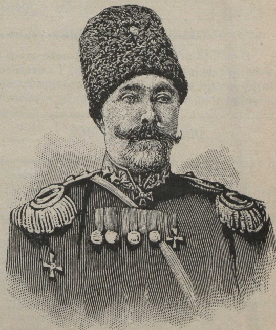
Le général Stessel, commandant de Port Arthur.

Dès le début des hostilités russo-japonaises, il avait été rumeur de l'envoi du prince Louis-Napoléon Bonaparte, comme chef de la cavalerie russe en Extrême-Orient. La nouvelle de la nomination du prince à ce poste élevé vient d'être confirmée. C'est donc avec un certain plaisir que nous offrons ici le portrait de ce Bonaparte, qui aime les armes et qui a passé sa vie à les étudier. Puisse la victoire sourire au petit neveu du Grand Empereur, qu'elle couronna tant de fois! Le prince Louis-Napoléon fera honneur à la France, sa patrie, et à la Russie, sa patrie d'adoption. Le nouveau commandant de la cavalerie de Mandchourie est un ami intime de l'empereur de Russie.