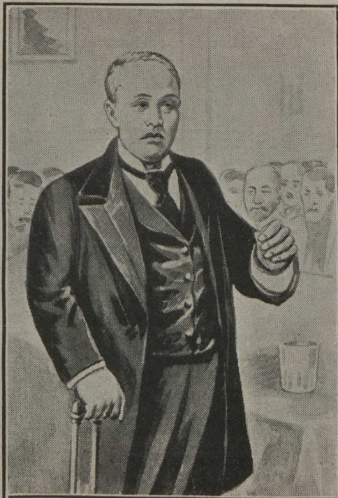
Le comte Okuma, chef de la Ligue antirusse, prononçant un discours dans une réunion plénière.

De tous les hommes politiques du Japon, son premier ministre, le marquis Ito est à juste titre considéré comme étant le plus capable. Très fin diplomate, homme d'Etat remarquable, le marquis est un de ceux qui ont fait le Japon moderne. Des dépêches toutes récentes prétendent que le premier Japonais s'est rendu en Corée