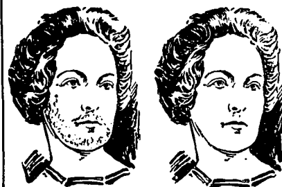
AVANT L'EMPLOI. APRES L'EMPLOI.