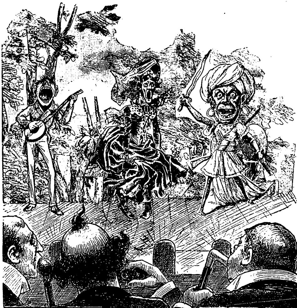
Le seul endroit où les vieux blasés peuvent se regaillardir.