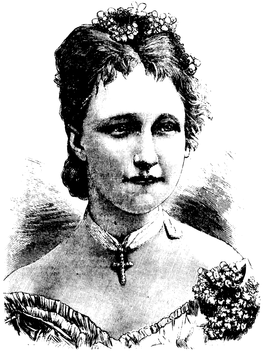
LA PRINCESSE STÉPHANIE DE BELGIQUE