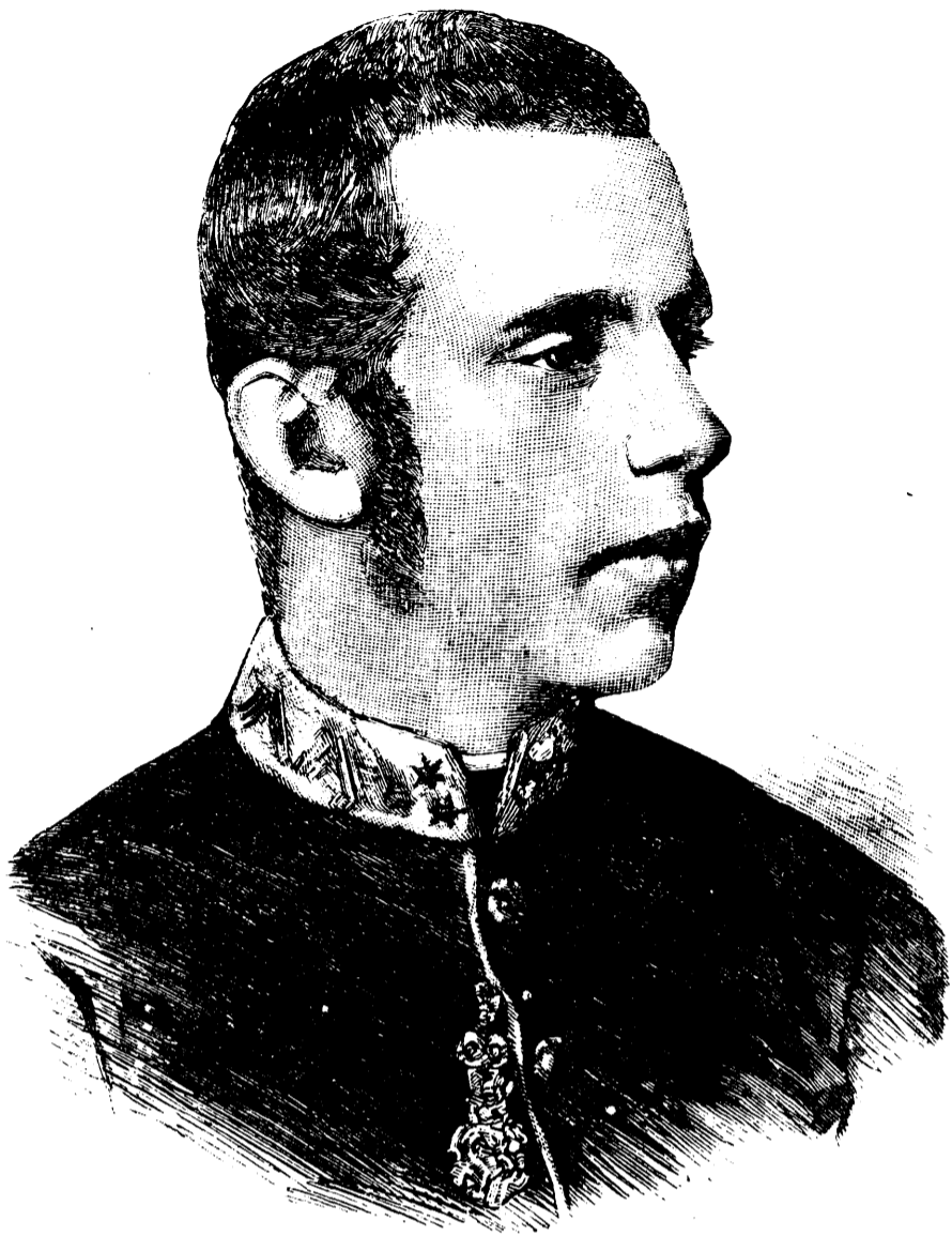
L'ARCHIDUC RODOLPHE, PRINCE ROYAL D'AUTRICHE