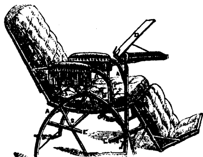
CHAISE AJUSTABLE DE WILSON.