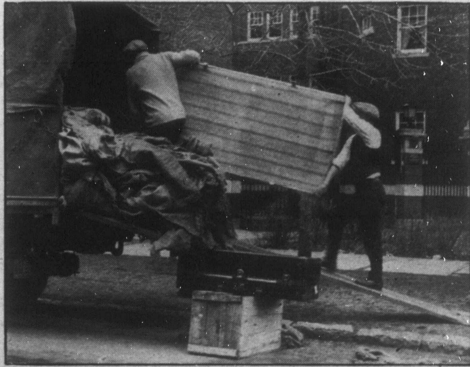
Augusztus elsején készült ez a fénykép, mely egy költözökösi jelenetet ábrázol. A gazdasági válság következtében sok helyütt leszálltak a lakásokban s különben is a tél előtt Kanadában divatos olyan lakásokba hurcolkodni, ahol a lakberbe már előre beleszámították a központi fűtés árát s hideg idő esetén nem kell sok szemet venni a lakónak. No meg valjuk csak be, hogy takarékosági szempontból mind kisebb és kisebb lakásokba "muffolnak" manapság az emberek.