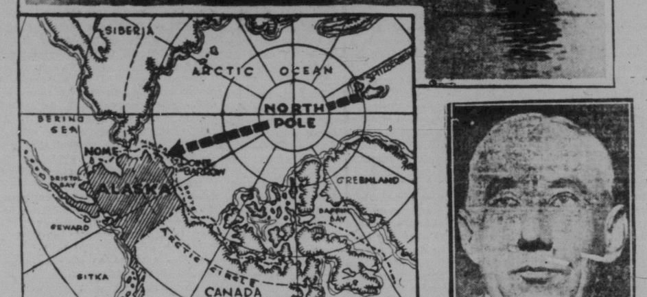
Den världsberömda upptäcktsresanden, kaptan Roald Amundsen, nedre hållet till höger; karta över nordpolen, dit han likt en modern viking ställt sin färd; bild av ett av hans aeroplan. Starten skedde från Kings Bay och den sträcka han har tillryggelagt är 690 mil en väg. Ännu vet man icke, om denna djärva bragd lyckats eller misslyckats.