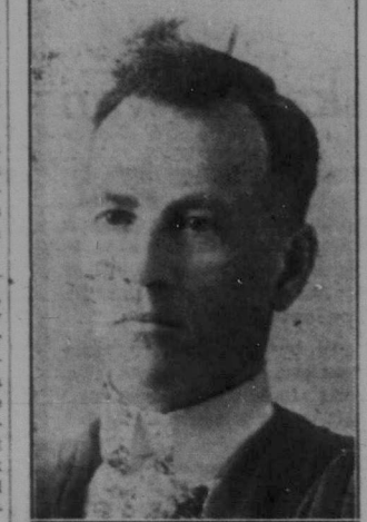
Hon. E. J. McMurray, den avgående generaladvokaten.

I december 1915 resignerade han som fältmarskalk samt blev då vicekommande av Ypres som ett erkännande av hans stora förtjänster i kriget. Sedan utgick han till överbefälhavare för United Kingdom samt kvarstod som sådan till 1918, då han utnämndes till vicekommande av Irland. Denna post höll han under de mest svåra förhållanden till i början av 1921. Då han resigerade från denna post, belönades han med grevlig värdighet. Mot slutet av kriget utgav lord French sina personliga iakttagelser av kriget i en bok endast kallad "1914". Lord Milner, f. d. brittisk krigsminister, har avlidit. General Fukuda i Tokio var f. v. åter utsatt för ett mordförsök av de röda.