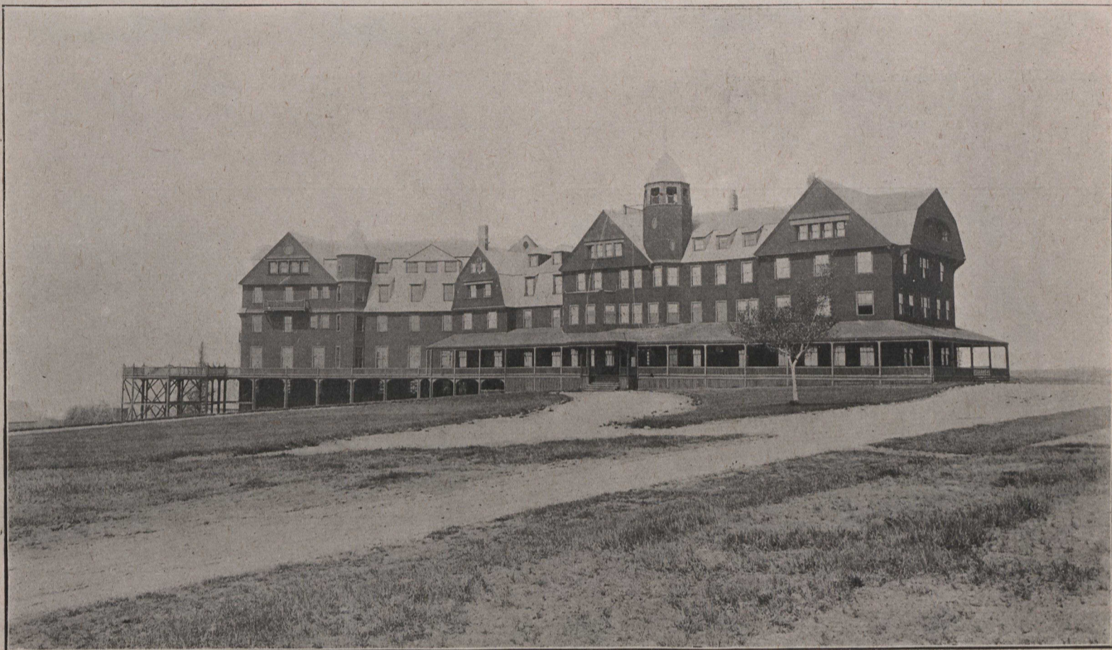
L'hôtel Algonquin, St-Andrews, N.-B. — Ligne du C. P. R.