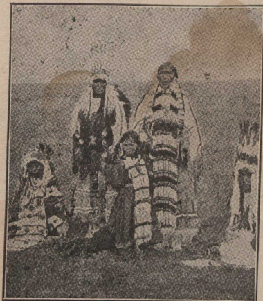
Une famille d'indiens du Nord Ouest

wan s'est transformée en un vent sec et périodique — le "chinook" — parfois si violent qu'il soulève des nuages de poussière, couche entièrement l'herbe des champs et fait plier les bouleaux, les trembles et les cyprès, seules essences forestières.