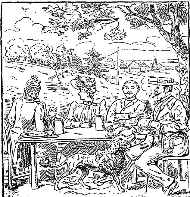
Une partie de campagne, trouvez la fillette à maman.