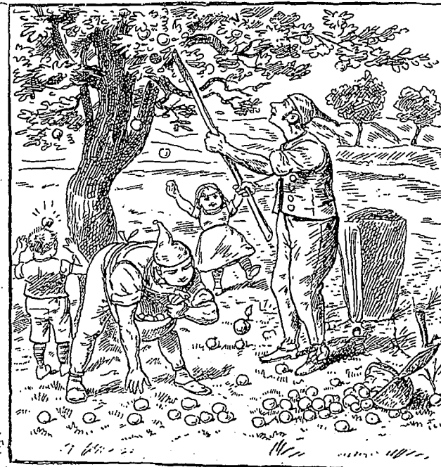
On vole des fruits dans le verger. Où est la fermière ?

Rapineau et sa femme vont dîner au restaurant avant d'aller au spectacle.