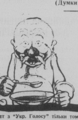
А поет з “Укр. Голосу” тільки тому не бідує, що шодня тяжко працює — коло миски.

“ТОЙ БІДУЄ, ЩО РОБИТЬ НЕ ХОЧЕ” (Думки на голос.)