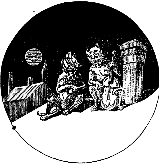
UNE IDYLLE SUR LES TOITS.

Ma-mia-ou! chante Minette, Ma-mia-ou! répond Matou!