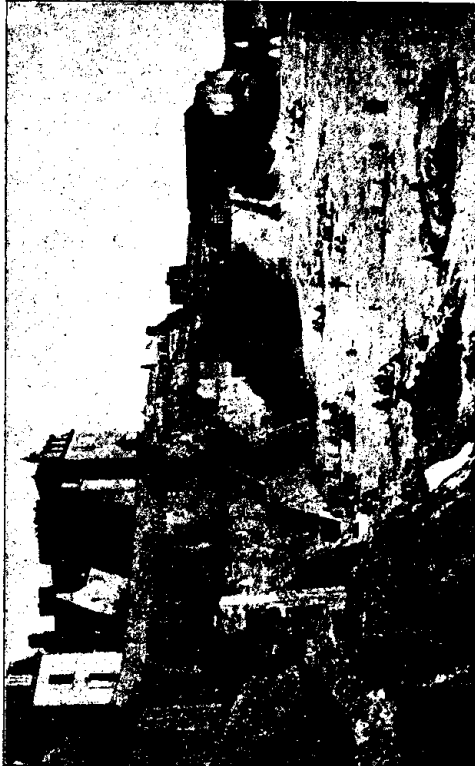
Les remparts et la porte de Bon-Secours