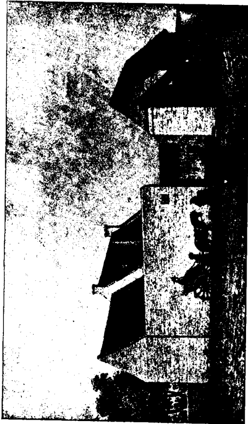
Manoir de Jacques Cartier a Limolou, près Saint-Malo, (vue extérieure)