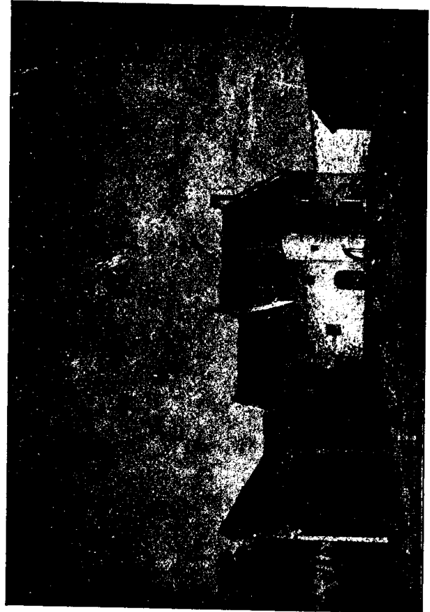
Manoir de Jacques Cartier a Limolou, près Saint-Malo, (vue intérieure)