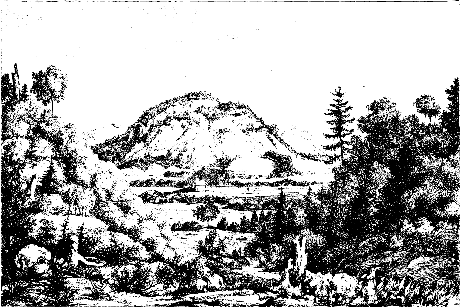
LE ROCHER DE CAMPBELLTON, VUE DU RUISSEAU MONIER, DERRIÈRE LA PETITE ROCHELLE, P.Q.