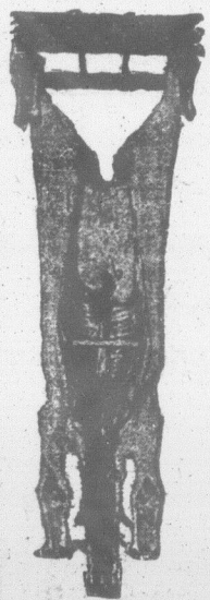
Manière de suspendre le veau, pour le laisser refroidir.

Expédiez-nous les sujets prêts à être mis sur le marché.