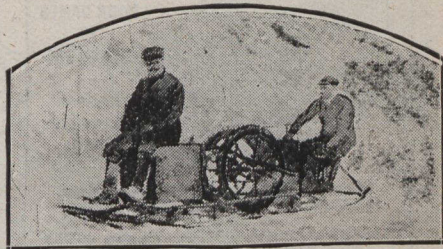
Premier essai de traîneau-automobile

Depuis vingt-cinq ans, la lutte contre la tuberculose est si active en Allemagne, que la mortalité de ce chef a diminué de 50 p.c., ce qui équivaut à 30,000 vies sauvées par années.