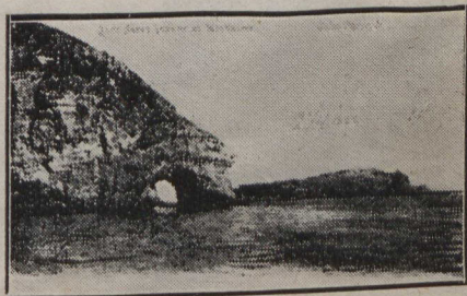
Le Cap Percé de Langlatte de St-Pierre et Miquelon