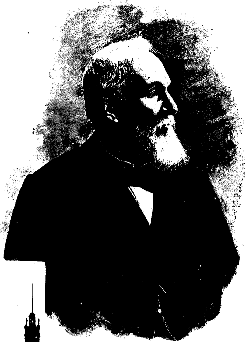
M. CHALLEMEL-LACOUR, DÉCÉDÉ