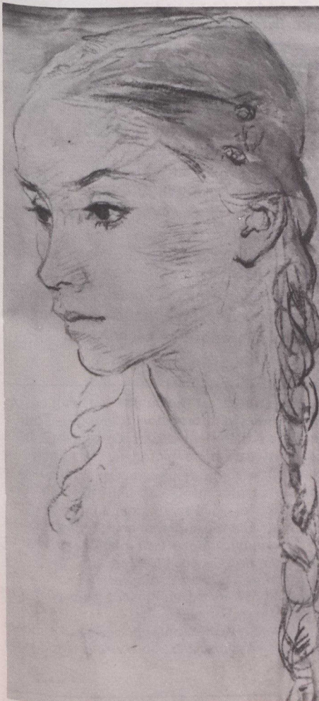
Shelagh, F.H. Varley, fusain aquarelle sur papier, 1947.