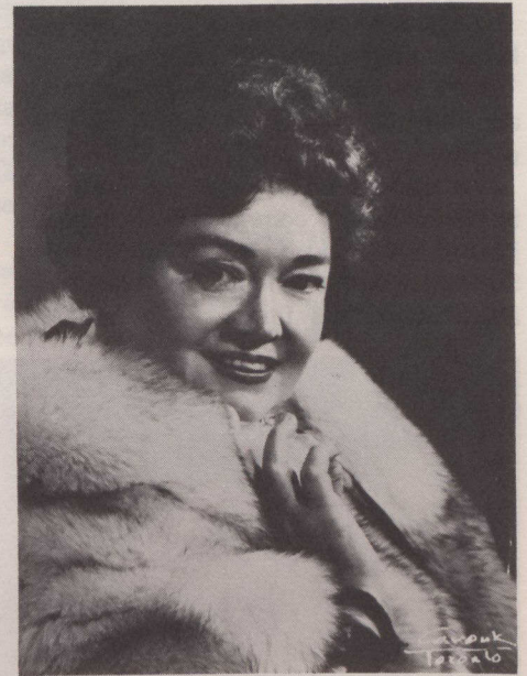
Lois Marshall, mezzo-soprano canadienne de renommée internationale.