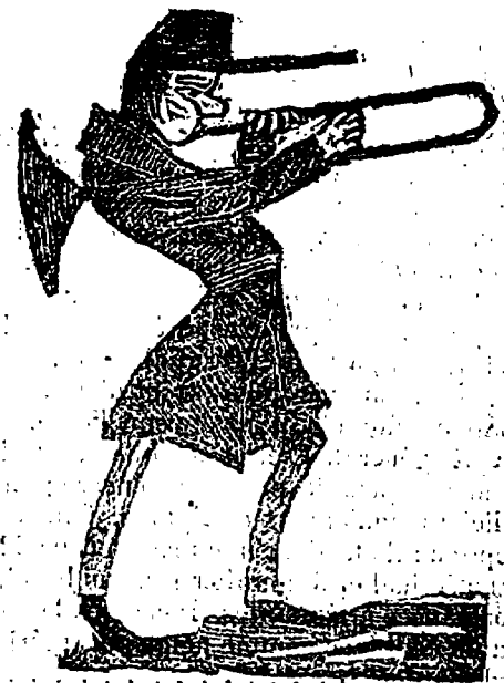
Musiciens de l'armée, plus beaux hommes de l'armée.