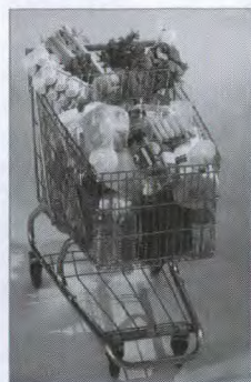
Les aliments transformés aboutissent dans les chariots.

Même si le marché russe de la transformation des aliments est principalement dominé par des entreprises européennes et asiatiques qui ont des bureaux de ventes ou des entrepôts en Russie, l'équipement fabriqué au Canada est apprécié et bénéficie d'une bonne réputation. Plus précisément, on indique que les acheteurs du Nord-Ouest de la Russie s'intéressent vivement à l'équipement canadien s'il leur est accessible. Mais, pour pouvoir mieux soutenir la concurrence, davantage d'entreprises canadiennes doivent établir une présence ou avoir des agents en Russie, et mettre en place des installations d'entreposage.