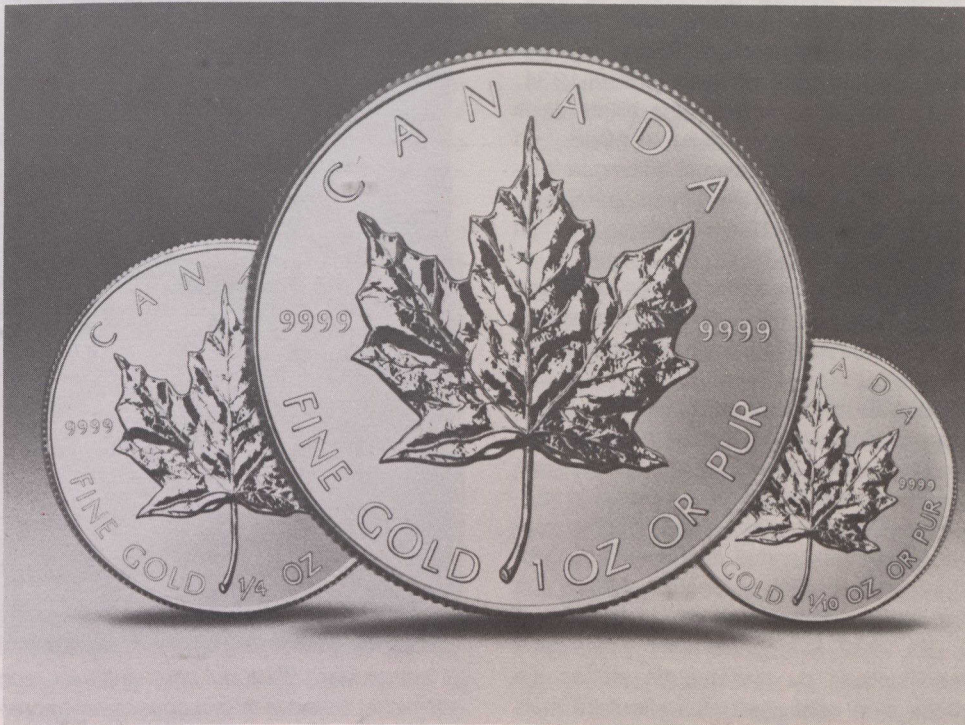
La Monnaie royale canadienne produit les pièces de la Feuille d'érable en or.

En effet, l'une des plus grandes difficultés de toute la période qui précéda le XX e siècle résultait du fait que l'unité officielle des comptes depuis l'année 1759 était la livre sterling, bien que cette devise fût