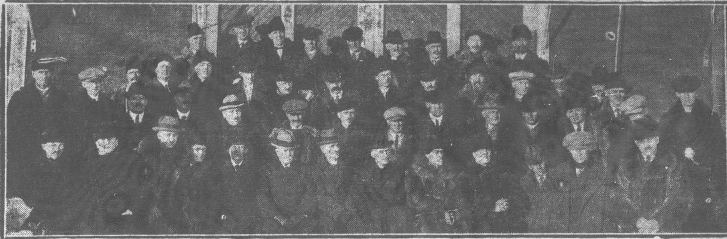
Les éleveurs d'Ayrshire du Bas du Saint-Laurent qui ont tenu récemment leur assemblée à Rimouski.

Sous l'impulsion de leurs agronomes, les éleveurs de bétail Ayrshire des comtés de Rimouski, Témiscouata, Matane et Matapédia se réunissaient, lundi, le 15 mars, à Rimouski. Le but de la réunion était de grouper en une association locale, les éleveurs de bétail Ayrshire, de les faire se connaître entre eux, de créer et de provoquer de saines émulations, de les amener à faire encore plus de Livre d'Or et de Tableau d'Honneur, de faire accréditer leurs troupeaux, de faire la propagande et l'annonce de bons sujets à vendre, en un mot de promouvoir les intérêts d'un chacun.