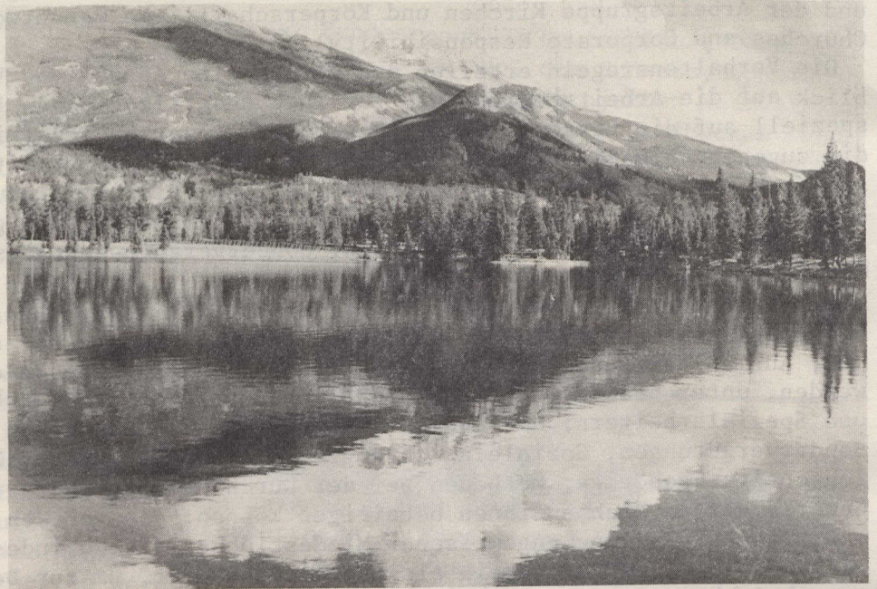
Mount Tekarra und Lac Beauvert im Jasper-Nationalpark (Alberta)

Die vierzehntägige Pauschalreise "Totem Circle Routes" beginnt auf der Insel Vancouver und umfaßt eine Fahrt durch die Georgie-Straße mit dem Fährschiff "Queen of Prince Rupert" sowie eine Tour durch den zentralen Teil der Provinz Britisch-Kolumbien und den Jasper National Park in Alberta. Der Preis ab Montreal beträgt pro Person 724 Dollar (auf Doppelzimmerbasis).