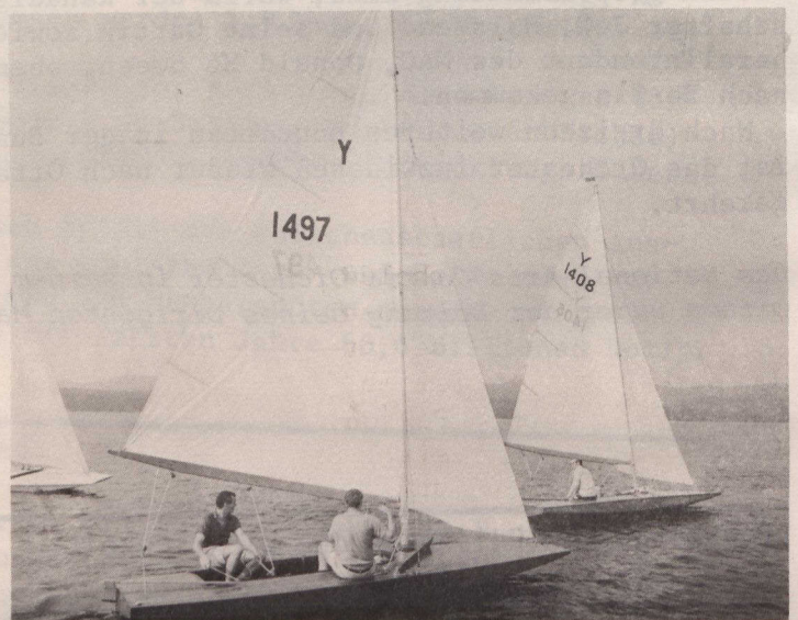
Segelboote auf dem Ottawa-Fluß