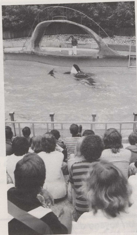
C'est l'heure du repas pour les épaulards.

pavillon aménagé en jungle amazonienne. Des piranhas, deux anacondas géants, des anguilles électriques, des marmousets, de verdoyantes plantes tropicales et 83 oiseaux en liberté sont dorénavant au nombre des surprises qui attendent les touristes. Un paresseux, deux iguanes, des geckos et des lézards y vivent également.