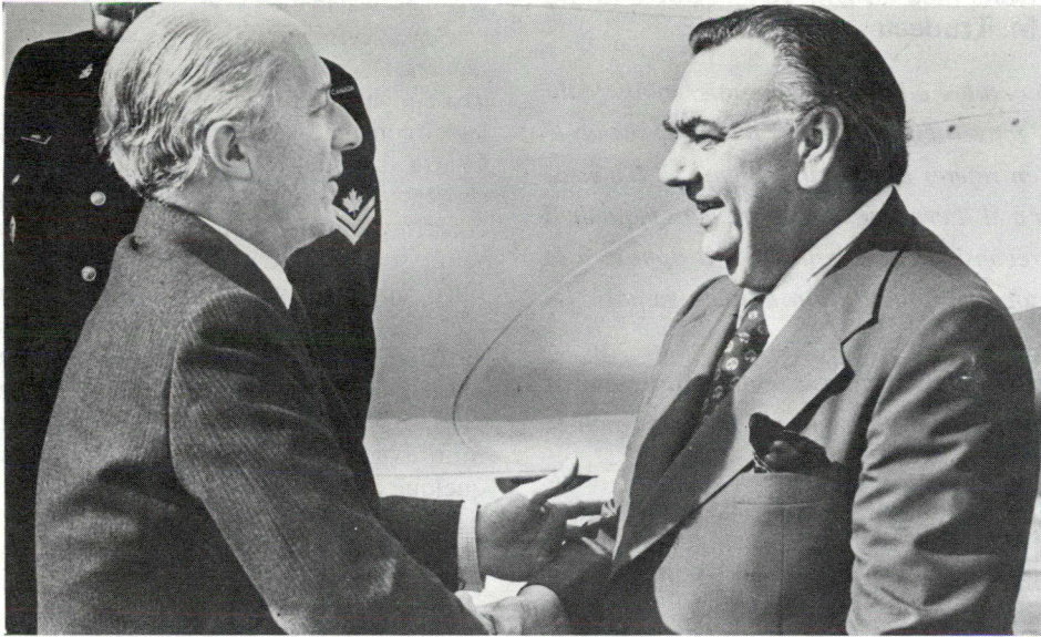
Le ministre français des Affaires étrangères, M. Louis de Guiringaud (à gauche), est accueilli à son arrivée à Ottawa, le 5 octobre, par son homologue canadien, M. Don Jamieson. Au cours de sa visite de deux jours M. de Guiringaud a eu des entretiens sur des questions bilatérales et internationales.