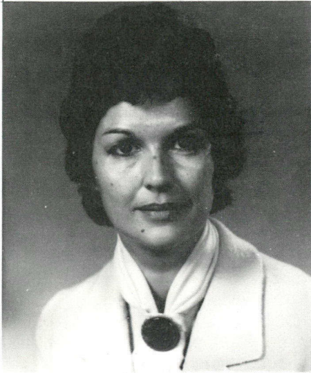
Pour la première fois dans l'histoire parlementaire canadienne, trois femmes feront partie du Cabinet des ministres. Elles ont été assermentées le 15 septembre par le gouverneur général. Il