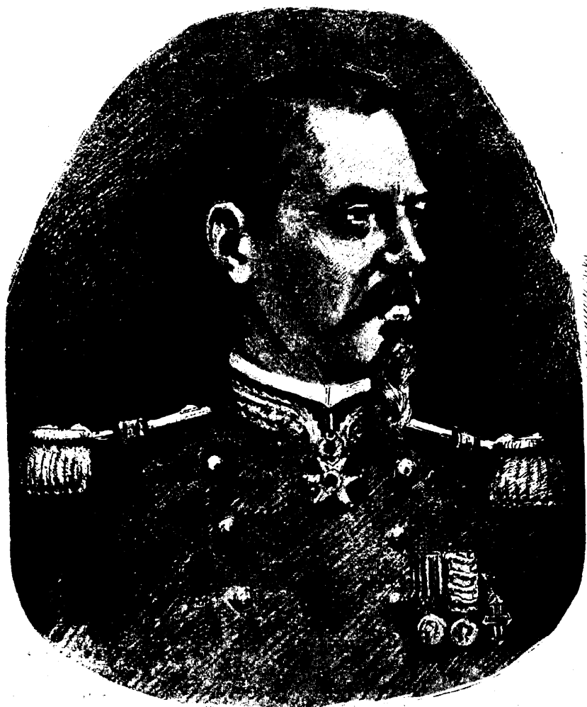
LE GÉNÉRAL CAFFAREL