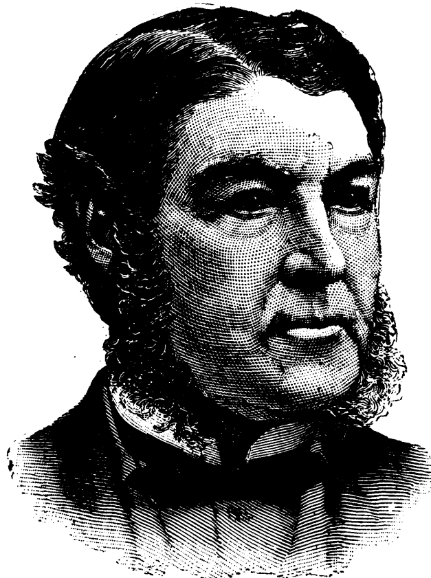
SIR CHARLES TUPPER, MEMBRE CANADIEN DE LA COMMISSION DES PÊCHERIES

La ligne, par insertion - - - - - 10 cents Insertions subséquentes - - - - - 5 cents Tarif special pour annonces à long terme