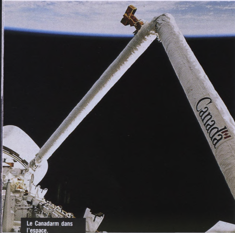
Le Canadarm dans l'espace.