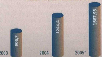
EXPORTATIONS CANADIENNES À DESTINATION DE LA RÉGION ANDINE (M $)

* Estimation fondée sur une hausse de 26 % des exportations vers la région au cours des six premiers mois de 2005.