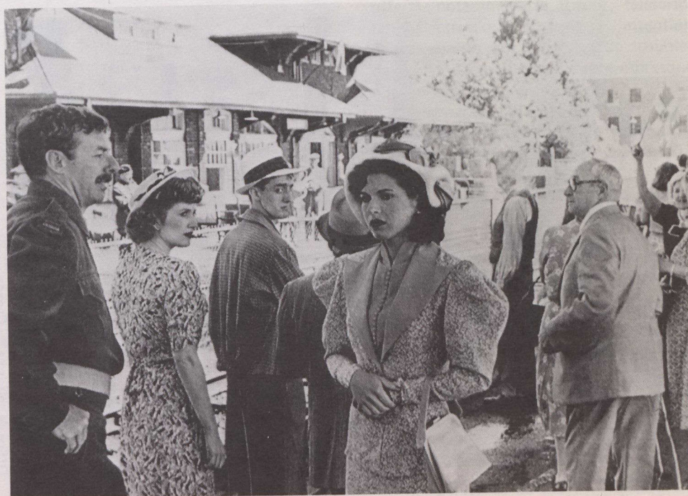
Scène du film Bonheur d'occasion , tiré du roman du même nom, de Gabrielle Roy.

Élue à la Société royale du Canada en 1947 et détentrice d'un doctorat honorifique de l'Université Laval, Gabrielle Roy a reçu le prix du Gouverneur général (1955), le prix Duvernay (1956) et le prix David (1971).