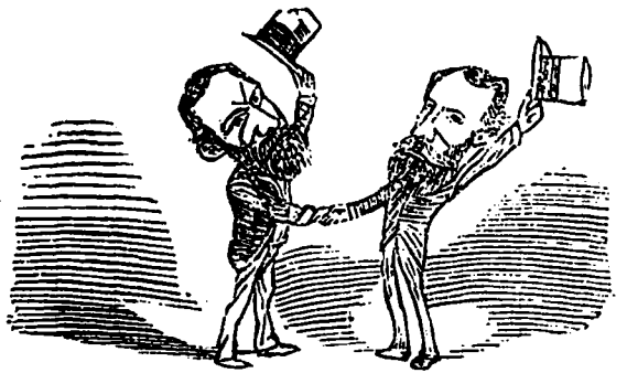
Il a pour lui-même une estime profonde et une admiration sans bornes.