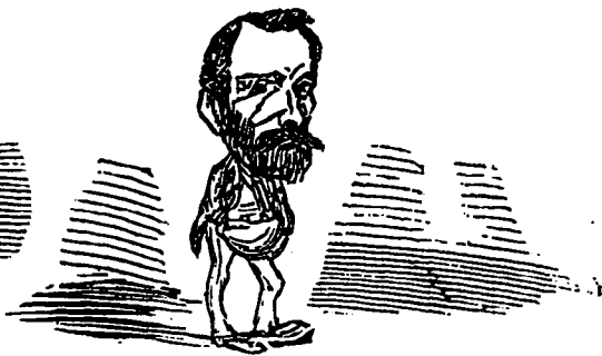
Ou d'un ventre proéminent.