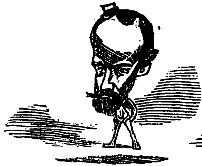
Il est ordinairement doué d'une cervelle énorme.