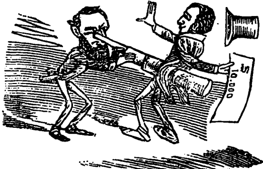
Son regard perçant sait juger à première vue de la valeur personnelle de ceux qui l'approchent.