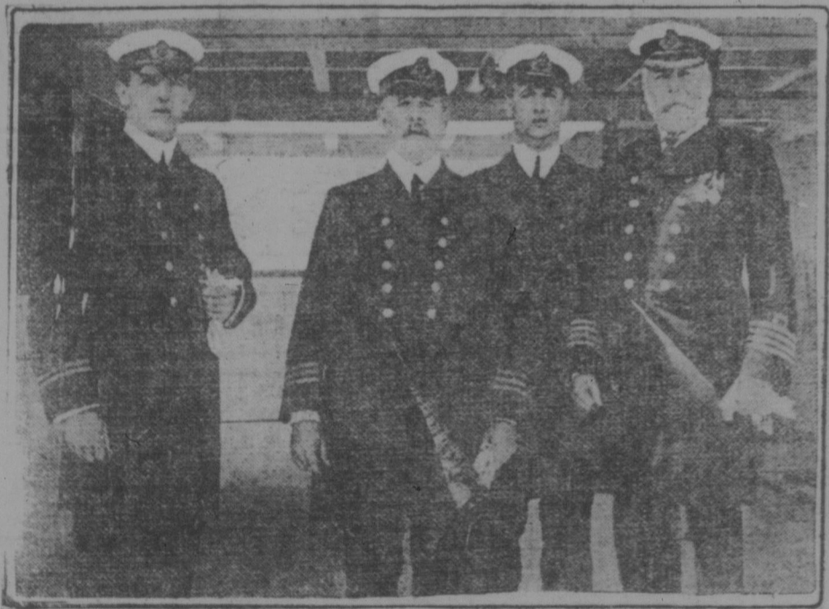
Kapitän Edward J. Smith auf der äußersten rechten Seite. Die anderen drei von links nach rechts...

Zugabdruck am Montag, traf dort aber nur Schiffstrimmer und die mit Fragen und Stöhnen belegten Lebensrettungsboote an.