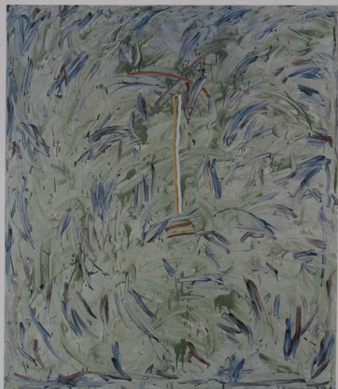
デビッド・ボルドウック「おうむ」(1976年作)