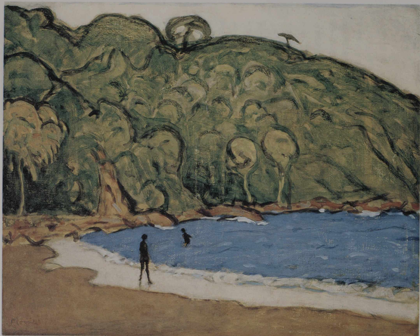
ジェームズ・モリス「風景—トリニダード」