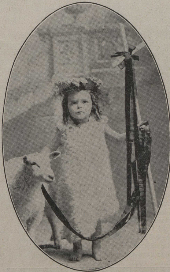
Un charmant Saint-Jean-Baptiste.