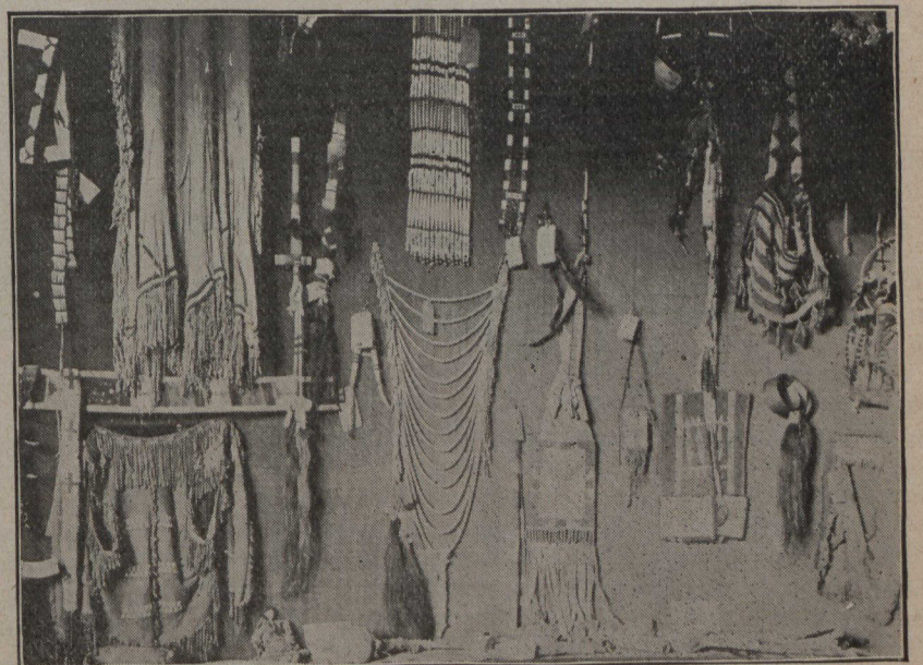
Curiosités indiennes, contenues dans la vieille tour Senneville, du domaine de Boisbriant.