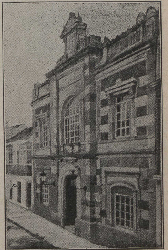
En Espagne. — La maison natale de Moralès, qui a attenté à la vie d'Alphonse XIII.