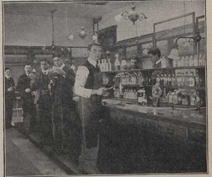
Un coin du laboratoire de l'Ecole polytechnique de Montréal, qui vient de bénéficier d'un don de $3,000, de la part du gouvernement de la province, pour la fondation d'autres laboratoires, etc.