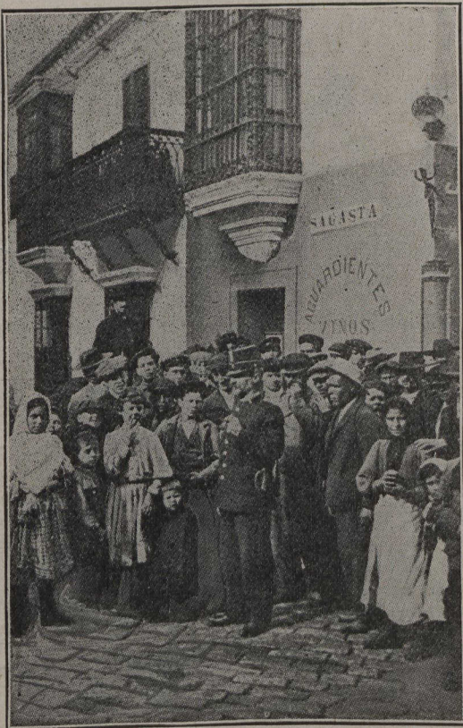
En Espagne. — Après l'attentat du 31 mai, contre S. M. Alphonse XIII, la police contient la foule dans une des rues voisines de la Calle Mayor.