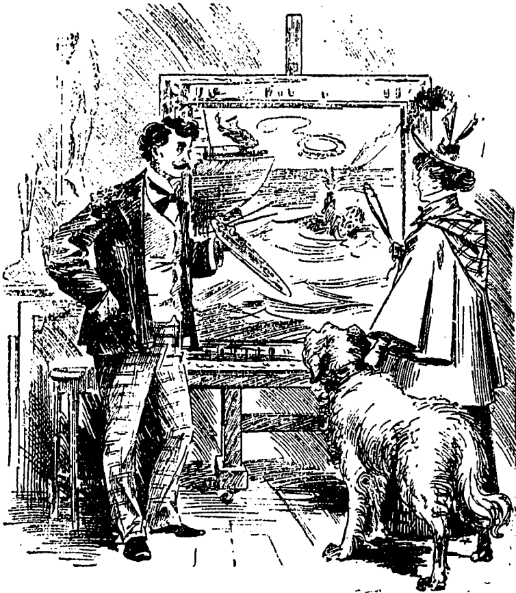
I La visiteuse. — C'est très beau ! Comment l'appellez-vous ce tableau ? L'artiste. — Un homme à l'eau.