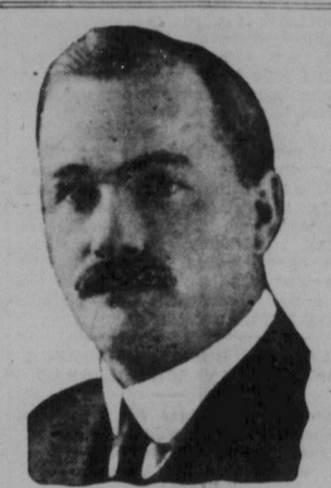
Hon. Chas. A. Dunning.

Med god majoritet lyftes Dunning och hans partimedlemmar utav valvågorna åter tillbaka till maktsens timmar. Valet stod som bekant i tisdags den 2 juni och de huvudsakliga resultaten så ut på onsdag morgon just som tillnagningen går i press, vad vi endast i all korthet kunna meddela följande: