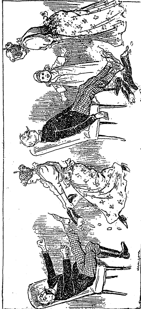
Enfin, tout s'explique et le papa respire à l'aise, mais bébé est averti de n'y plus retourner.