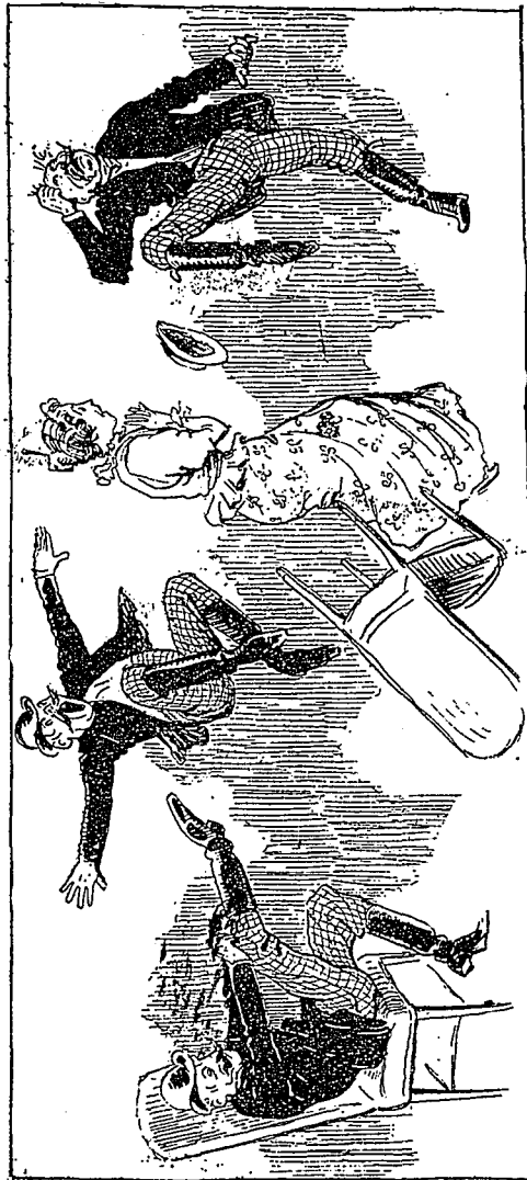
— Diable !... Aïe !... Aïe !... quel supplice intolérable !... s'écrie le papa.